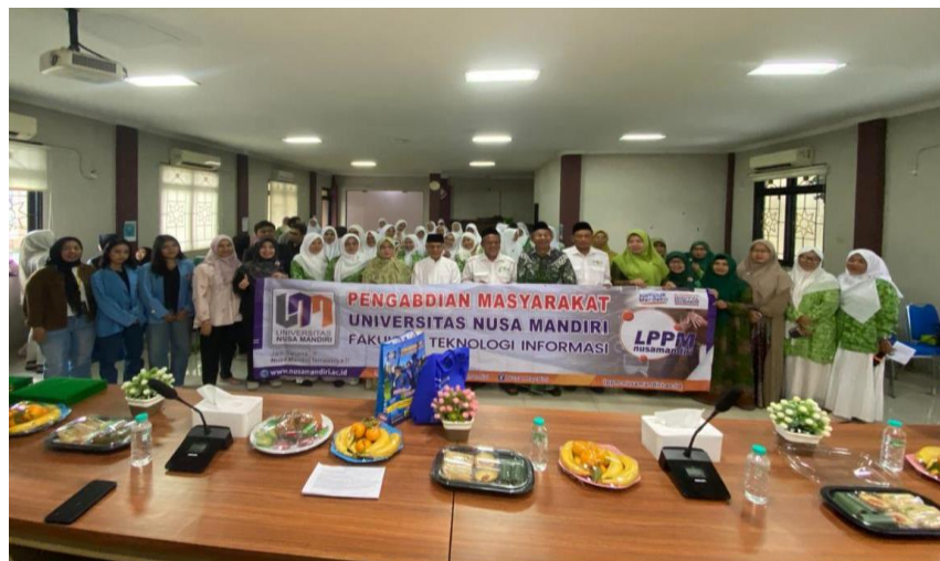
Gambar 4. Sesi Foto Bersama Pengabdian Masyarakat UNM

Melalui kegiatan ini, diharapkan para pelaku UMKM dapat lebih adaptif terhadap perkembangan teknologi, meningkatkan kualitas produk, serta memperluas jangkauan pasar. Kegiatan ini juga diharapkan dapat memberikan dampak berkelanjutan dalam pemberdayaan ekonomi masyarakat, khususnya perempuan, di Kota Tangerang.