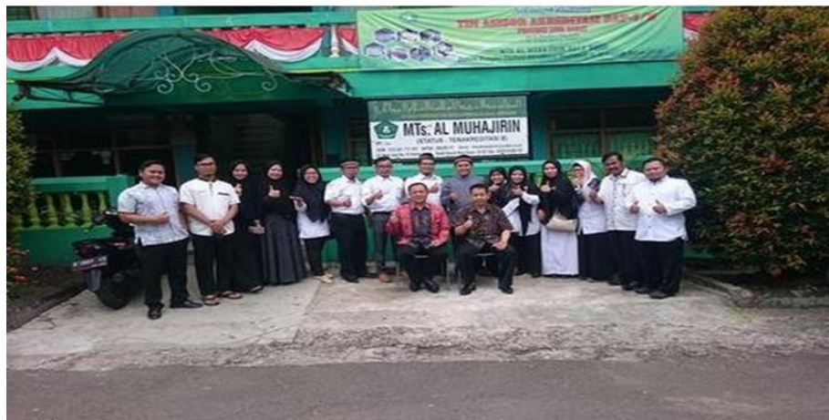
Gambar 1: Lokasi Yayasan Pendidikan Dan Kesejahteraan Islam Al Muhajirin Kota Bogor

Mitra dalam Pengabdian Masyarakat terkategori Mitra non Produktif yaitu Yayasan Al Muhajirin berdiri pada Tahun 1994 dengan alamat domisili di Jalan Haur Jaya I Nomor 1 Kelurahan Kebon Pedes Kecamatan Tanah Sareal Kota Bogor. Mitra pengabdian masyarakat saat ini adalah Yayasan Al Muhajirin merupakan Yayasan Al Muhajirin yang memberikan banyak manfaat untuk warga yang ada SEJABOTABEK. Pelatihan akan diberikan kepada pengurus Yayasan Al Muhajirin Kota Bogor. Pemanfaatan teknologi Informasi Aplikasi Canva akan sangat membantu dalam melakukan Metode Pembelajaran lebih menarik guna meningkatkan pemahaman staffnya dalam mengelola media sosial di Yayasan Al Muhajirin.