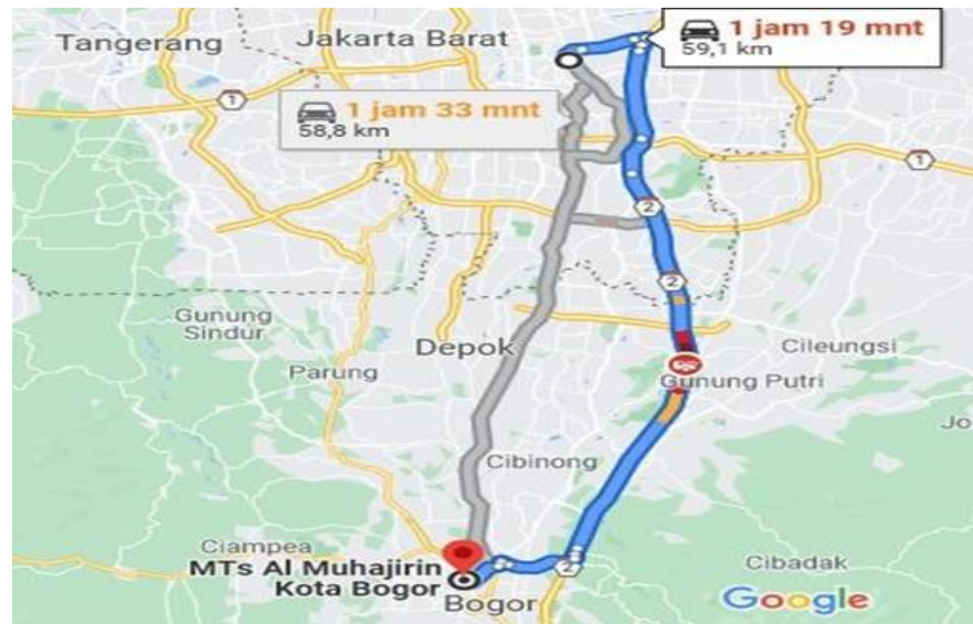
Gambar 2 Jarak Lokasi Mitra pengabdian masyarakat

Berdasarkan penjelasan permasalahan mitra. Maka dapat dijelaskan sebagai berikut: